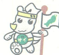
東北財務局キャラクター ザイチ