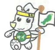
東北財務局キャラクター ザイっち